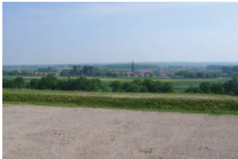
Het uitzicht vanaf Belvédère laat zich vergelijken met de klassieke stadspanorama's vanaf Sint Pieter, Cadier en Keer, en Berg en Terblijt.

De ecologische waarde van de berg schuilt in de biotopen van droge muren, graslanden en ruigtes. De inrichting van Belvédère is gekoppeld aan het gelijknamige herstructureringsproject van de stad Maastricht. Het landschapsontwerp kenmerkt zich door een kruidenberg met hellingbanen, bergpaden, een bergkam en een speelveld. De landschapsontwikkeling kan pas starten als er vol-