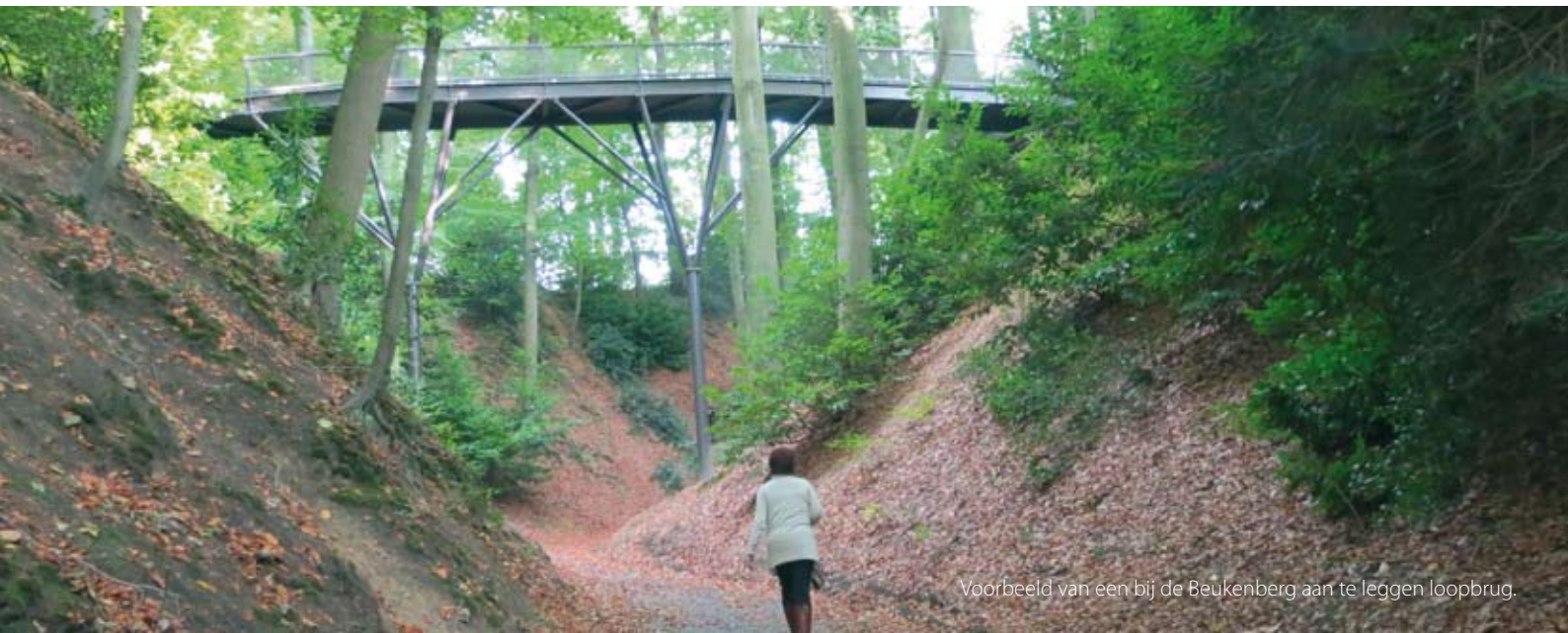
Voorbeeld van een bij de Beukenberg aan te leggen loopbrug.

aansluitingen. Zo bestaat er een plan om over een beekdroogdal een loopbrug aan te leggen (zie foto). Om de locatie verder aantrekkelijk te maken voor wandelaars is het de bedoeling dat er een 10 meter hoog uitkijkpunt wordt aangelegd waar men een wijds uitzicht heeft op de omgeving.”